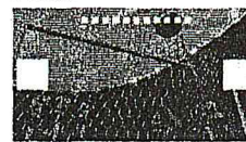
Бразилия — Германия — 1:7